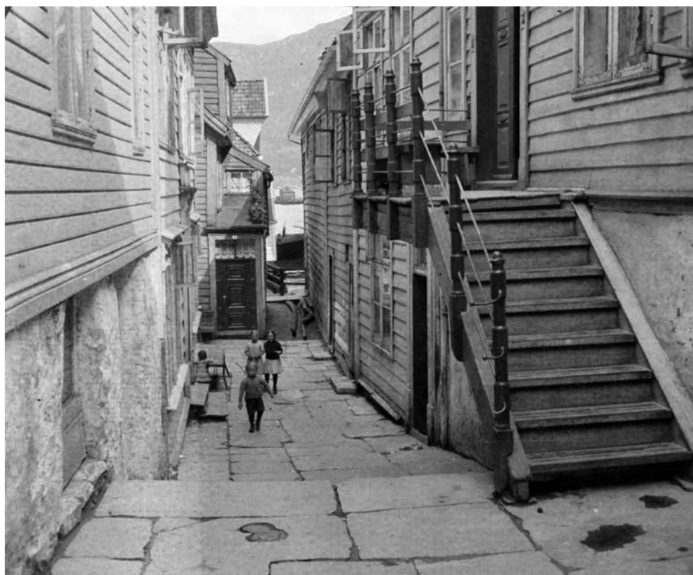
Strandsiden, Ravnekroken