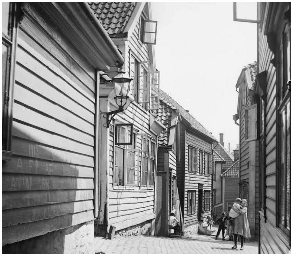
St. Hansstredet/Knøsesmuget.