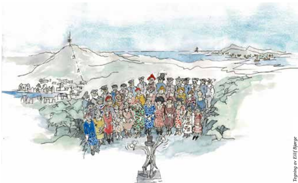
Tegning av Eilif Bjerge